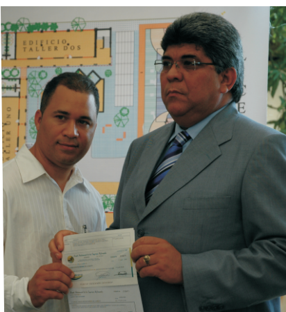
El presidente del FONPER, mientras entregaba el cheque para el inicio de los trabajos