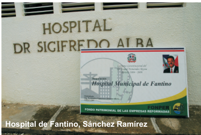
Hospital de Fantino, Sánchez Ramírez