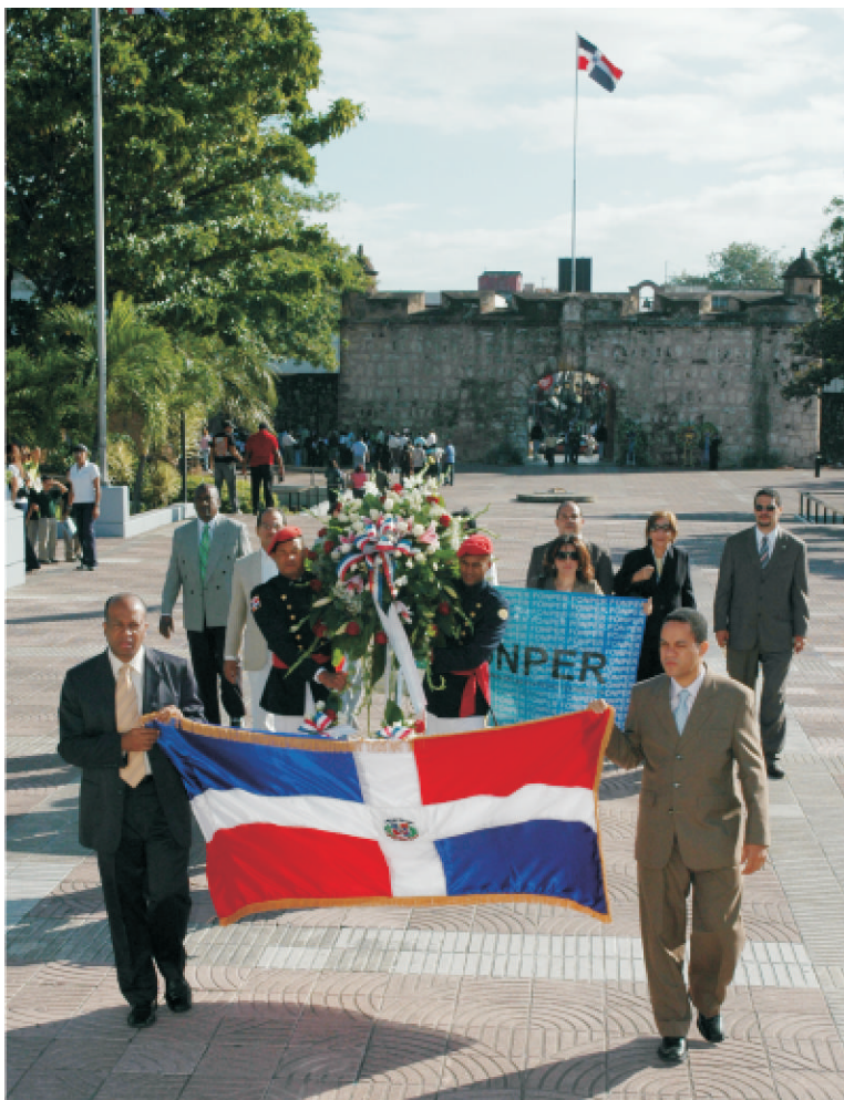
El vicepresidente del FONPER instó al pueblo dominicano a reflexionar sobre la dimensión de la obra de Duarte, Sánchez y Mella