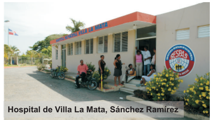
Hospital de Villa La Mata, Sánchez Ramírez