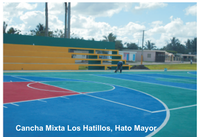
Cancha Mixta Los Hatillos, Hato Mayor