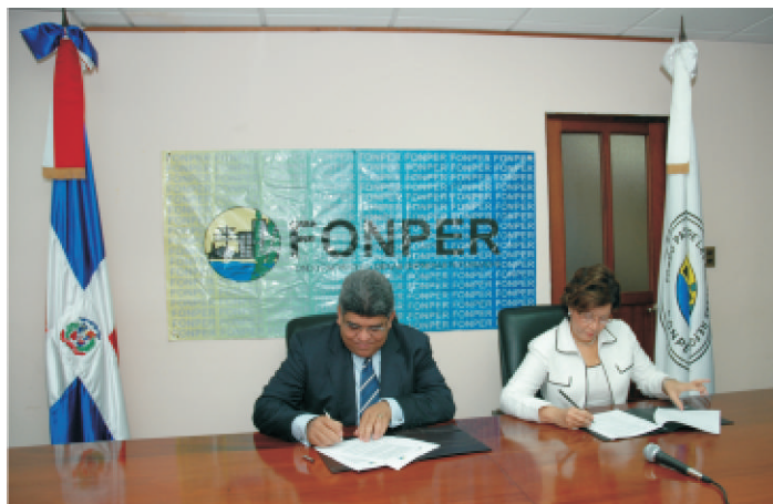
El apoyo financiero del FONPER pone al INFOTEP en capacidad de llegar a una mayor cantidad de jóvenes en todo el país

De igual manera, destacó que el convenio le permite al INFOTEP ampliar su marco de operaciones y de esa manera poder llegar a una cantidad cada vez mayor de jóvenes en las diferentes regiones del país.