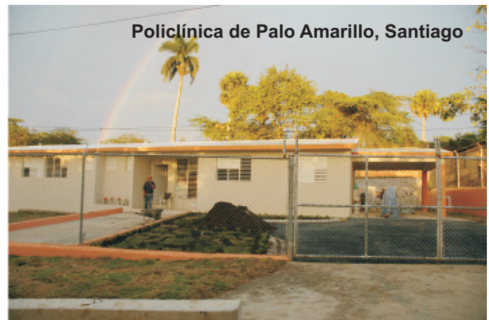
Policlínica de Palo Amarillo, Santiago