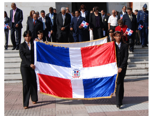
Tributo a Duarte, Sánchez y Mella

Consejo de Directores del FONPER, funcionarios medios y empleados de la institución, así como algunos integrantes de la Comisión de Reforma de la Empresa Pública (CREP).