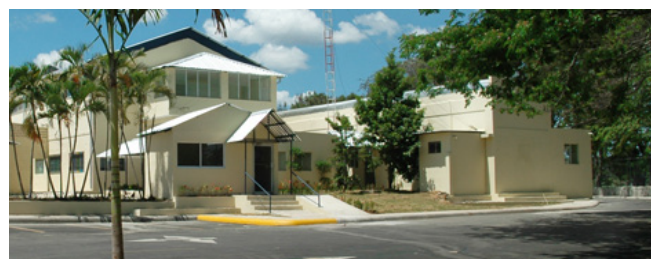
Parque Industria de La Canela

En la primera etapa se instalarán varias asociaciones productivas entre las que se encuentran metalmecánica, costura y confección, y los cluster de la industria del mueble.