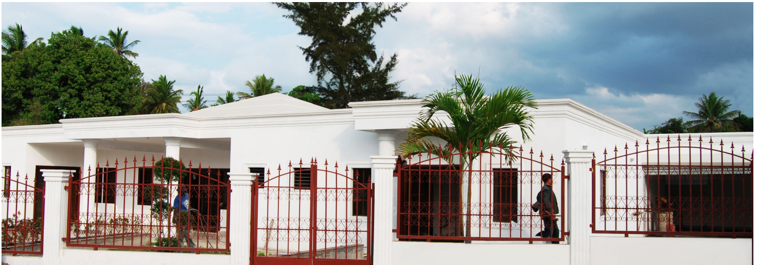
Funeraria en construcción

PEKIN, SANTIAGO.- Está en su fase final la funeraria que construye el Fondo Patrimonial de las Empresas Reformadas (FONPER) en esta comunidad para el Instituto de Auxilios y Viviendas (INAVI).