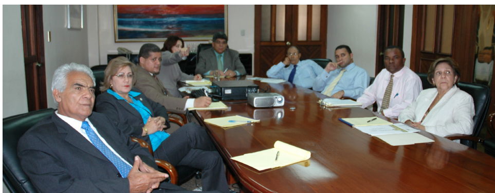
Primera reunión del año

mientos resultan un tanto molestos, pero debemos actuar siempre apegados a ellos, por el bien de la institución, del país y de nosotros mismos”, recalcó el Licenciado Rosa.