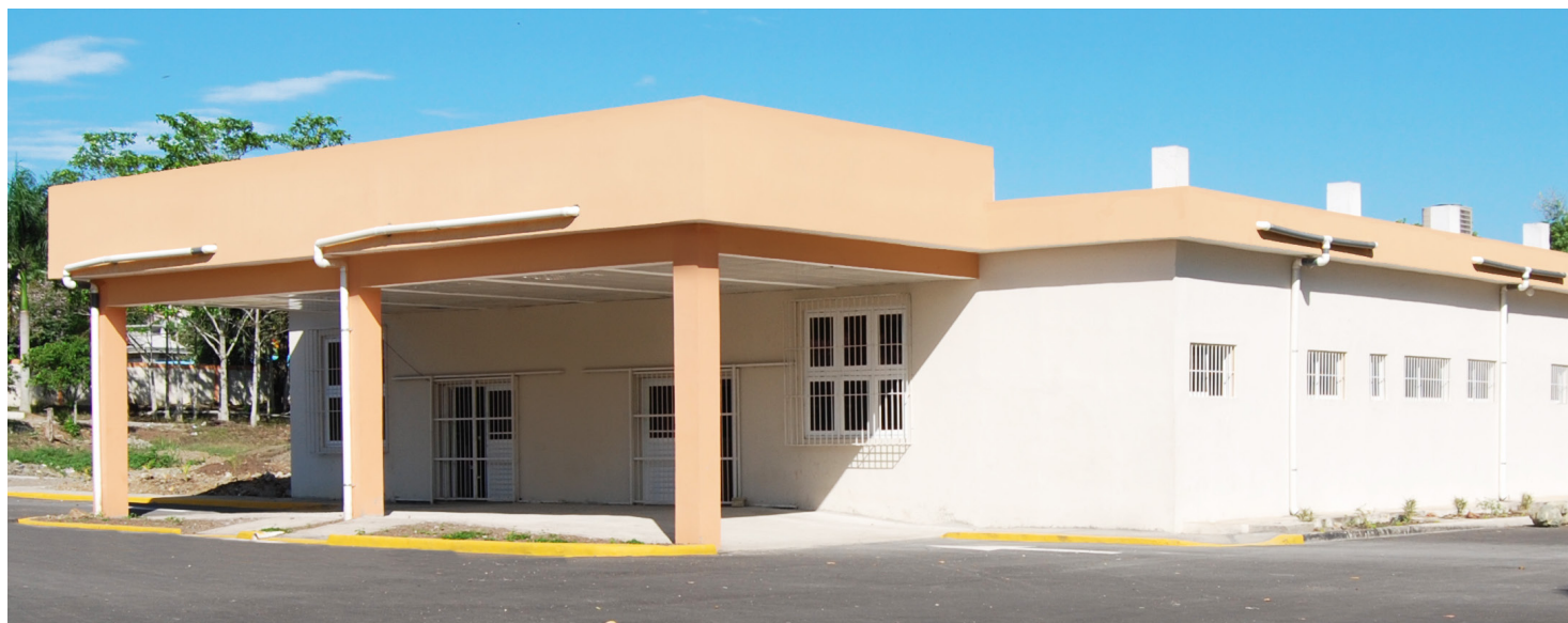
Nueva emergencia del hospital de Cotuí

Tanto el presidente del FONPER como el ministro de Salud Pública han destacado la importancia de la iniciativa y dejan abierta la posibilidad de desarrollar de manera conjunta otros proyectos encaminados a beneficiar a las personas de menores ingresos.