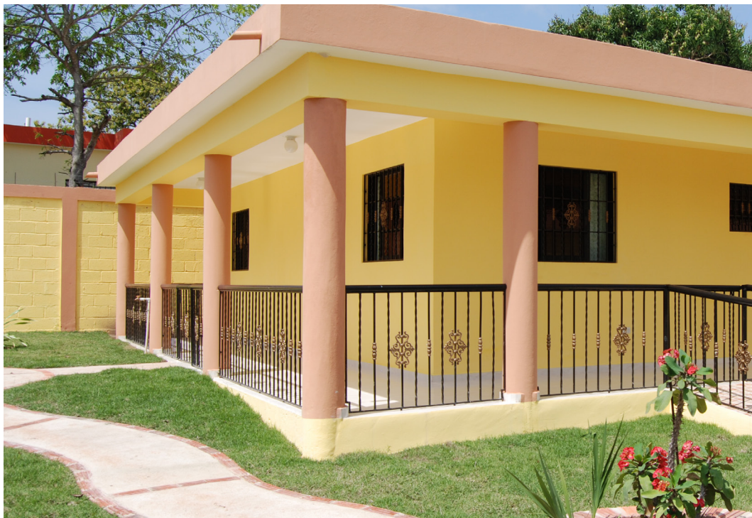
Nuevo pabellón construido por el FONPER

plemente estamos cumpliendo con nuestro deber como funcionario de un Gobierno que está para servir... Y esto es un granito de arena de todo lo que el Estado debe servirle al pueblo”, insistió.