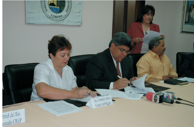
Aspecto de la firma del convenio entre el FONPER y el INFAS