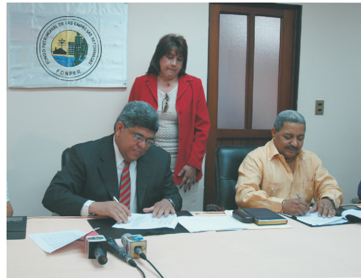
El FONPER becará 20 estudiantes del Centro Carl, por cada uno de los cuales pagará 3 mil 500 pesos todos los meses.

destacó que suman seis los convenios interinstitucionales suscritos por el FONPER en lo que va del presente año para desarrollar iniciativas a favor de los más necesitados.